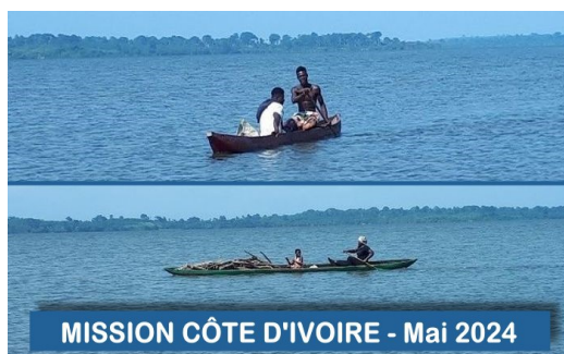
MISSION CÔTE D'IVOIRE - Mai 2024

CÔTE D'IVOIRE - L'association " SESAME " partenaire de Marins Sans Frontières a effectué une évaluation des besoins des populations maritimes et lacustres qui confirme le diagnostic établi par MARSF en juin 2024 : " Nous ambitionnons de parcourir le plan d'eau, aussi bien en lagune qu'en Mer, depuis la région d'Adiaké frontalière du Ghana voisin et la région de Tabou frontalière au Libéria. L'objectif étant de mettre en place des unités d'intervention d'urgence dans chaque région sur tout le Littoral, composées d'infirmiers et d'aides-soignants. Par ailleurs, en dehors de ces régions où de petites embarcations seront nécessaires, nous avons identifié 3 grands pôles d'interventions qui vont superviser ces régions :