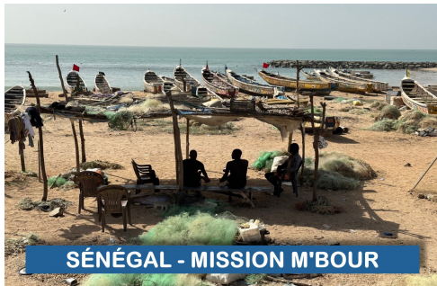
SÉNÉGAL - MISSION M'BOUR

SÉNÉGAL – En Casamance, La situation politique incertaine laissait entrevoir des difficultés pour l'activité des associations à caractère humanitaire. Heureusement, la nomination du premier ministre originaire de Casamance laisse espérer une période plus dynamique dans cette région et cela devrait permettre à l'association des médecins français ANIMA de poursuivre sa mission en consolidant ses relations avec le grand centre médical de Ziguinchor.