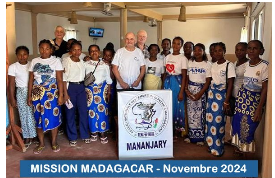
MISSION MADAGACAR - Novembre 2024

Notre mission en 2024 a aussi permis d'évaluer les besoins des communautés de « petits » pêcheurs, très nombreuses (500), dans les régions de Tuléar et de Mananjary. Des contacts fructueux ont été établis avec le Réseau National des Femmes de la Pêche (RENAFEP) qui est une organisation nationale très structurée des femmes des différents métiers de la pêche (pêche, collecte, mareyage). Nos échanges ont permis de confirmer leur besoin en moyens de conservation par le froid (glacières portables, conteneurs réfrigérés) afin de pouvoir écouler des produits frais vers les villes.